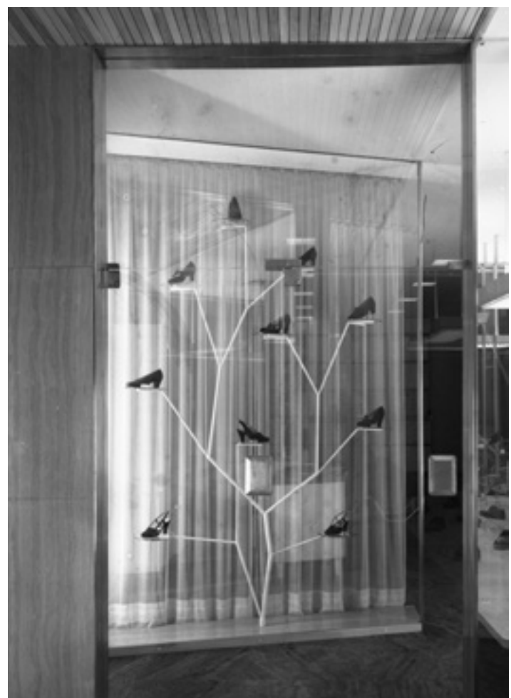
Vetrine in centro a Reggio Emilia, anni '50-'60