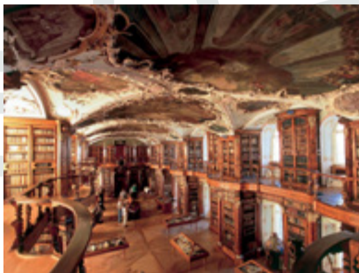
Biblioteca della abbazia di San Gallo (Svizzera) che si dice abbia ispirato quella del romanzo "Il nome della rosa" di U. Eco

Non si può non essere catturati dal fascino degli scaffali di certi grandi archivi o delle biblioteche storiche o degli scaffali della fantasia narrativa come quelli straordinari della Biblioteca di Babele, del Nome della Rosa o di Mr. Ollivander della saga di Harry Potter.