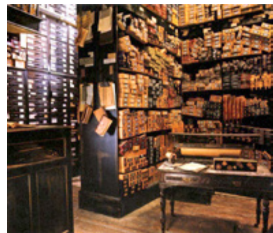
Il negozio delle bacchette magiche di Mr. Ollivander della saga di Harry Potter