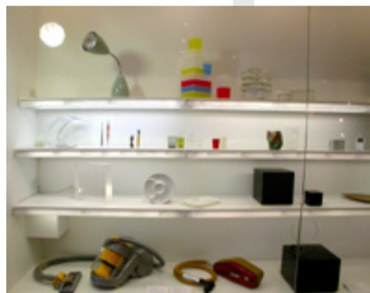
Selezione oggetti di design contemporaneo Museum of Modern Art-NewYork

Questo fatto risulta più evidente nel caso dello scaffale di un museo perchè di esso, non potendosi prelevare le opere contenute, l'unica lettura ammessa è quella dell'insieme con tutti i suoi contenuti (reperti, didascalie, video, ecc.). Infatti lo scaffale di un museo è prodotto da un autore - il curatore - che vuole trasmettere delle precise informazioni che vanno ben oltre il significato dell'oggetto esposto.